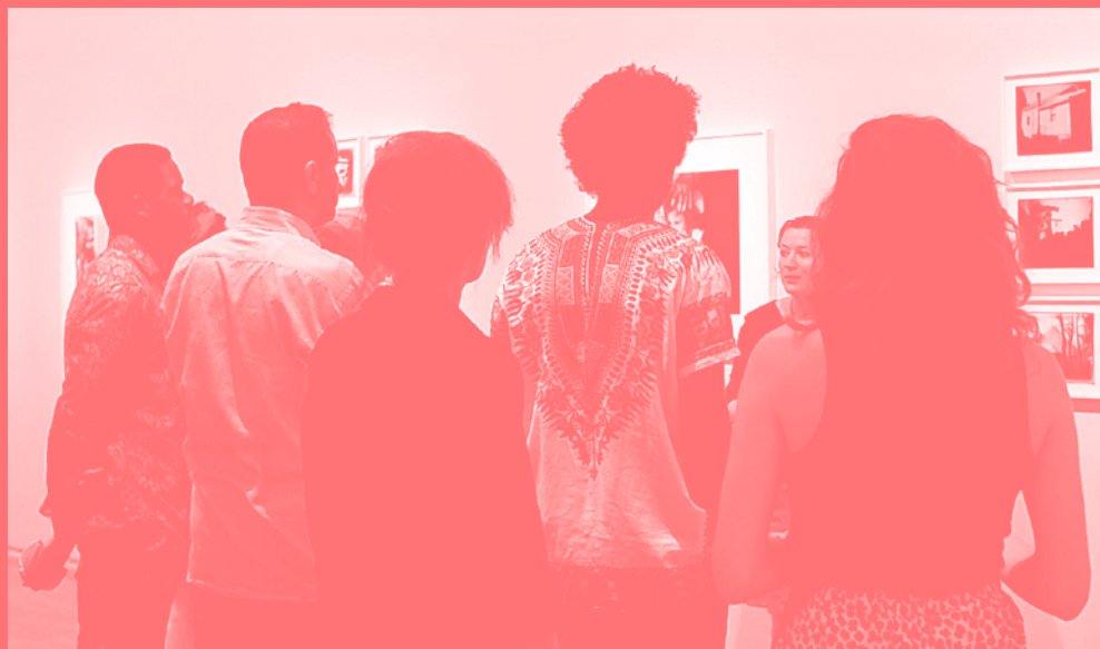
visite de l'exposition Sally Mann. Mille et un passages , photogramme du film de Philippe Ulysse, Une semaine à l'école de l'aa-e , 2019.