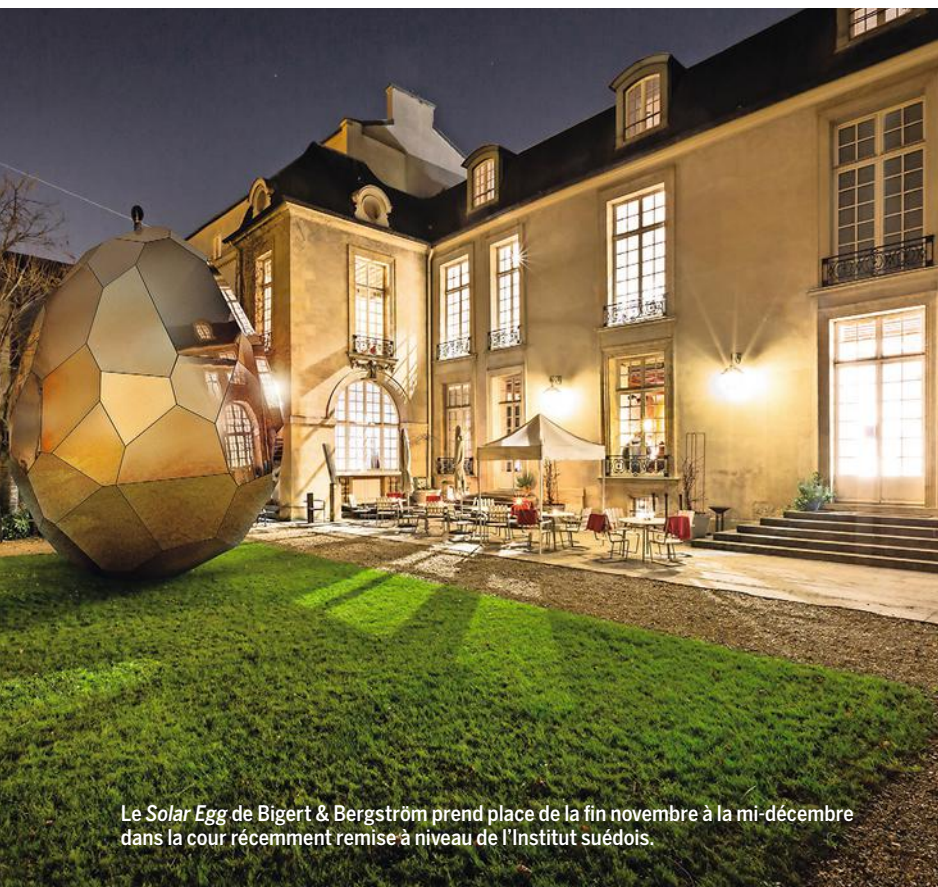
Le Solar Egg de Bigert & Bergström prend place de la fin novembre à la mi-décembre dans la cour récemment remise à niveau de l'Institut suédois.